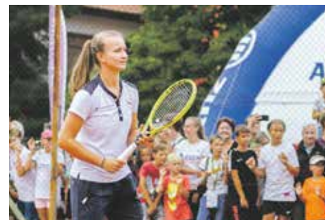
Cenu Jihomoravského kraje převezme také tenistka Barbora Krejčíková.

Cenu převezme také bývalá první dáma, herečka a filantropka Dagmar Havlová, tenistka Barbora Krejčíková i politik, právník a dlouholetý předseda Ústavního soudu ČR Pavel Rychetský.