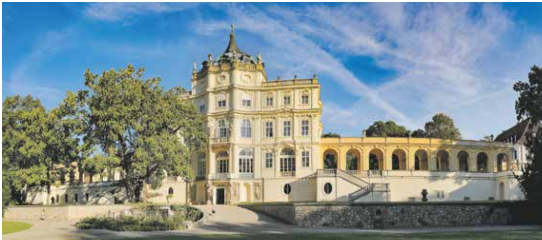
Jak Habsburkové bydleli v Čechách a na Moravě v 18.–20. století a jak zděděná či zakoupená sídla přizpůsobovali svému vkusu a zálibám, ukáží letos zámky Konopiště, Plaskovice (na snímku) a Zákupy.

Hrady, zámky a další památkové objekty po zimních měsících opět uvítají veřejnost. Po nutné údržbě a úklidu bude zahájen letošní návštěvnícké sezony ve znamení Velikonoc. Většina památek otevře své brány 28. března.