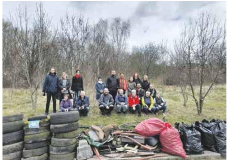
Množství odpadu, který dobrovolníci během jednoho dne v přírodě najdou, je často šokující.

Zájem o akci, kam se hlásí spolky, školy, různé organizace, ale i vedení měst a obcí, každým