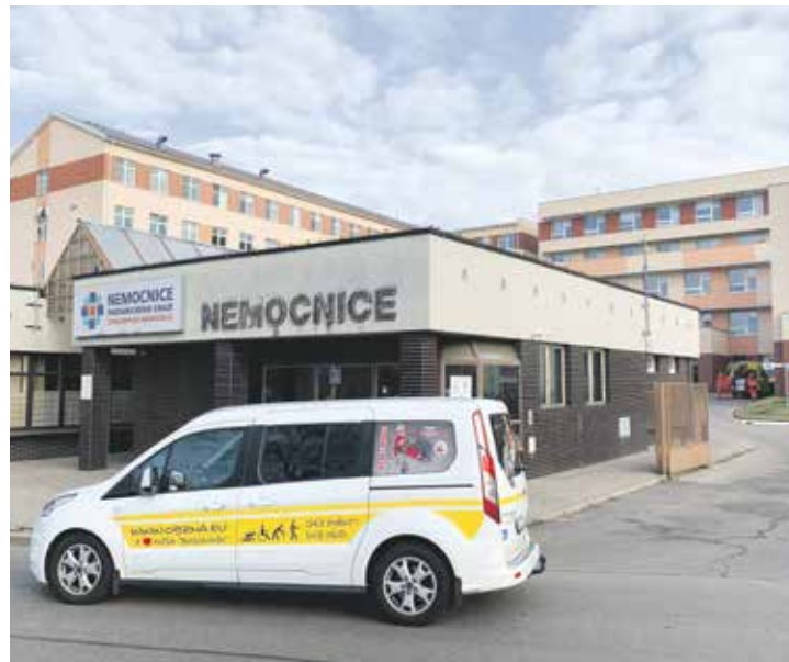
Pozdvižení vyvolala informace, že město chce provozovat nemocnici.

600 milionů korun a zahrnuje chod celého města. Jen na mzdy Chrudimské nemocnice bylo potřeba v roce 2021 přes 630 milionů korun. Další stovky milionů na provoz.