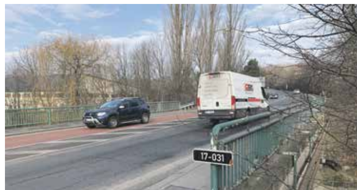
Most bude uzavřen do pouli.

buduje provizorní lávka pro pěší, aby bylo možné se dostat od sídliště Husova k nemocnici. Zásadní rekonstrukcí projde celý most, který bude přibližně pět měsíců uzavřen. rm